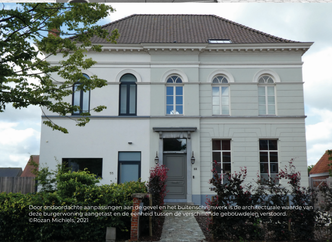
Door ondoordachte aanpassingen aan de gevel en het buitenschrijnwerk is de architecturale waarde van deze burgerwoning aangetast en de eenheid tussen de verschillende gebouwdelen verstoord.